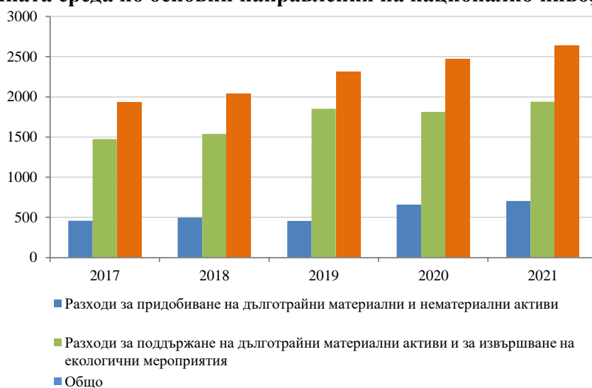
Фиг. 1. Динамика на изразходваните средства за опазване и възстановяване на околната среда по основни направления на национално ниво, млн. лв.