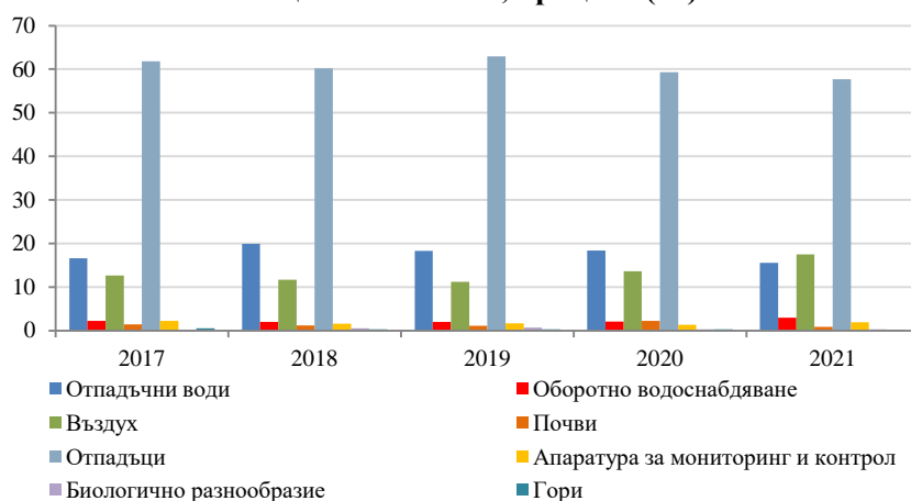
Фиг. 2. Структура на разходите за опазване на околната среда по основни направления на национално ниво, процент (%)